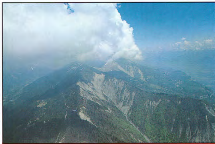
13b30 : devant le bec Charvet.

Direction la face Est où on remonte avant les paravalanches.