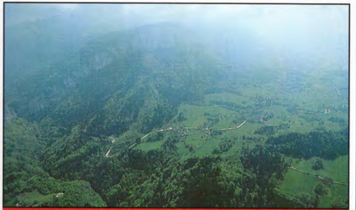
15b10 : au-dessus des Echelles.