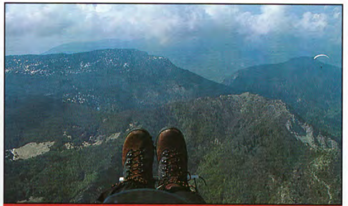
14b40 : au Nord du Granier, devant le col du Planet.

Au-dessus du Néron, je retrouve devant moi l'autre face du Mont Rachais. La boucle est bouclée. A droite, Grenoble. Le retour vers Saint-Hilaire serait possible, mais un orage se forme au Nord. Après un tour sur la Bastille, je décide sagement de me poser. XM