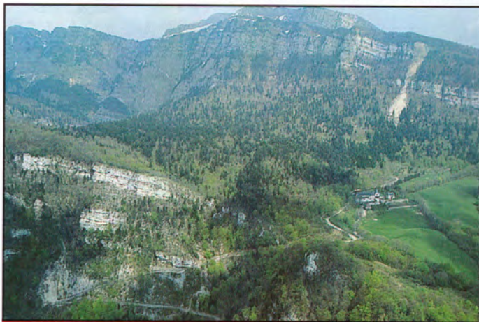
15b40 : au-dessus du pic de la grande Aiguille.