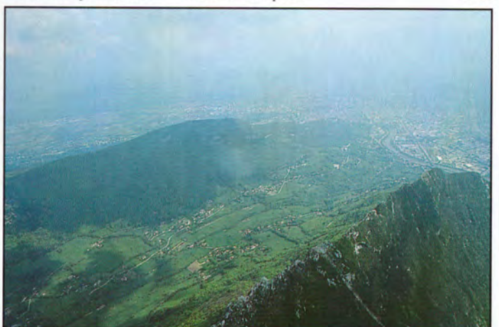
16b : au-dessus du Néron, face au mont Rachais et à la Bastille.