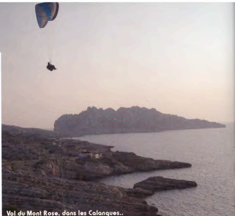
Vol du Mont Rose, dans les Calanques..

Un site majeur avec plusieurs décos et une école pour débiter et se perfectionner : L'envol de Provence. (Site décrit dans le hors série Parapente Mag 2006 des plus beaux sites hors Alpes). www.ailedesignes.com