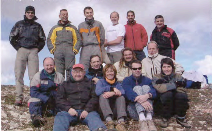
Quelques piliers du club Parapente de la Sainte-Victoire.

au-dessus de la route en bord de mer. Approche à faire avec une réserve d'altitude suffisante.