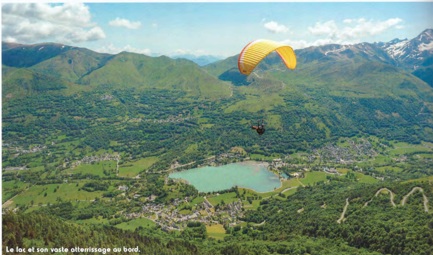
Le lac et son vaste atterrissage au bord.