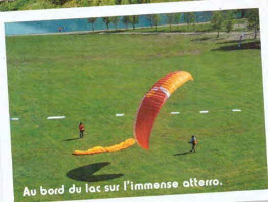
Au bord du lac sur l'immense atterro.

"Décollage de la station de Peyragudes, ensoleillée très tôt le matin ce qui permet d'accrocher les premiers thermiques dès 10 ou 11h. Monter à pied après la station le plus haut possible. Attention à la réglementation de l'aérodrome d'altitude. Une fois en l'air, le plus évident est de partir à gauche pour chercher les pentes les plus raides, les plus généreuses en thermique. On arrive en général à remonter lentement mais sûrement au-dessus du col de Peyresourde. Sans être trop pressé (il est encore tôt), essayer de se diriger vers l'Outiga, un massif tranquille avec vue magnifique sur les vallées du Louron et de Bagnère. Gratter le maximum sur ce pic. Peu à peu un décalage doit vous amener au-dessus du lac de Nères puis vers le Hourgade, pic impressionnant avec ses falaises immenses et généreuses en thermiques puissants. On